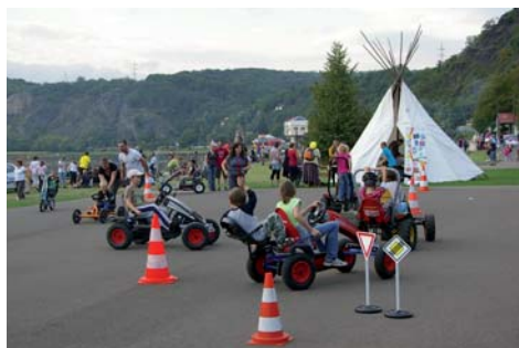
Fotografie ze Slavností pořídil Martin Lemon