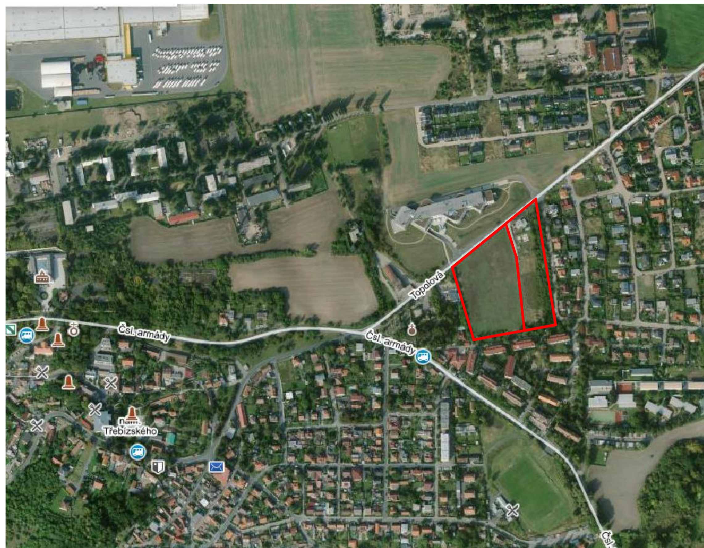
ZÁKRES DO ORTOFOTOMAPY 1:4000