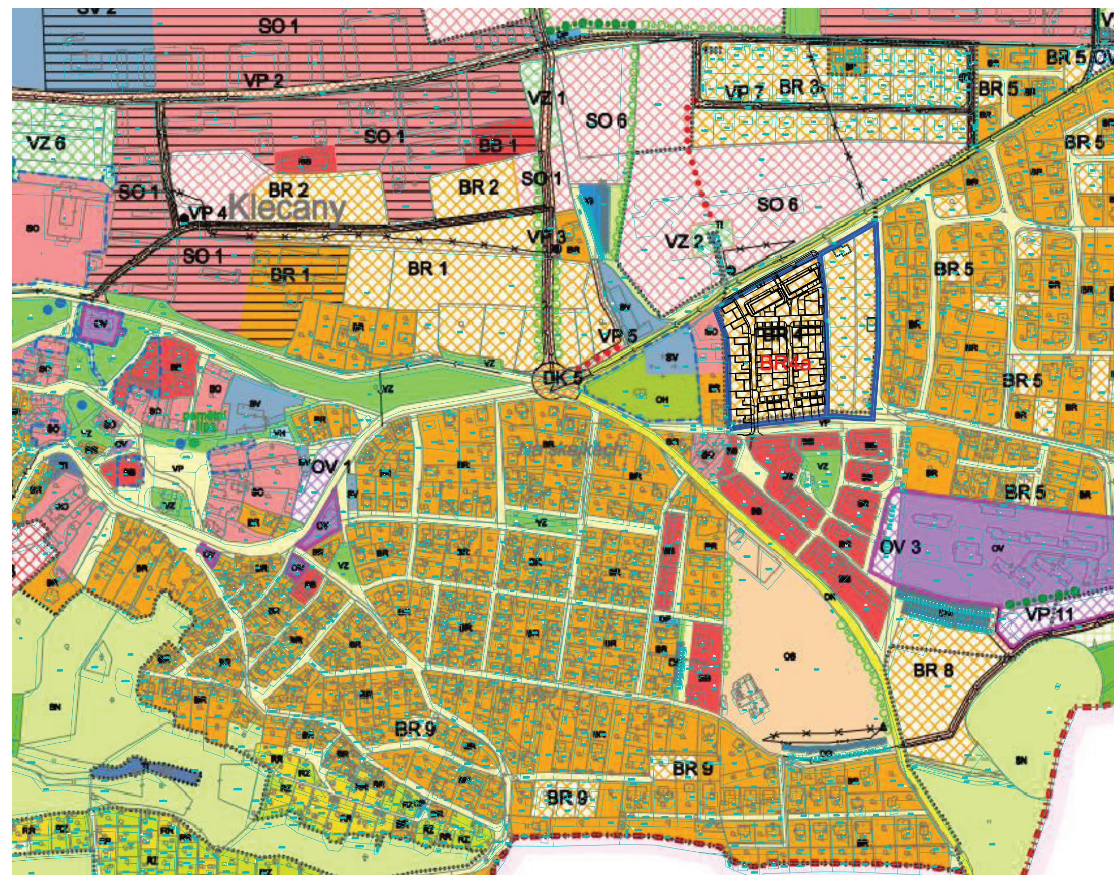
ZÁKRES DO HLAVNÍHO VÝKRESU ÚZEMNÍHO PLÁNU ZMĚNA Z4 1:4000