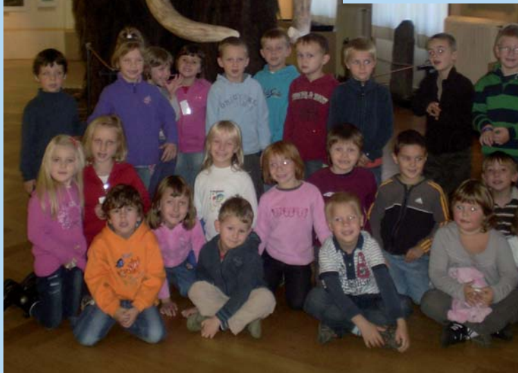
Naši nejmenší při vánočních přípravách a při návštěvě Národního muzea